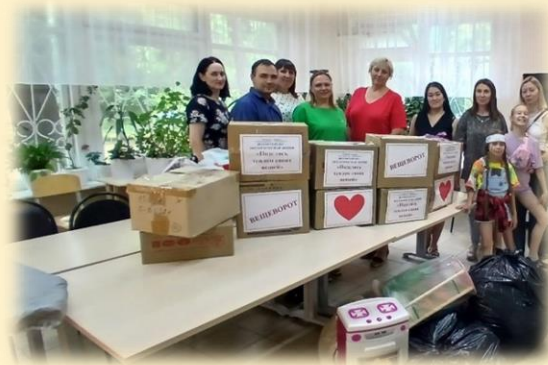
Акция «Победа одна на всех»