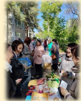
Благотворительная ярмарка «Мы за мир, за дружбу!»